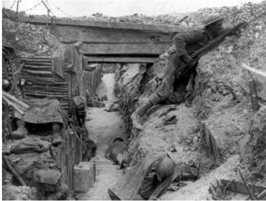
Okopy I wojny światowej

Data 11 listopada 1918 roku ma szczególne znaczenie w dziejach ludzkości. W tym dniu zakończyła się I wojna światowa (1914-1918). Delegacja niemiecka podpisała rozejm z państwami Ententy, a marszałek Foch w imieniu sprzymierzonych państw podyktował Cesarstwu Niemieckiemu wstępne warunki kapitulacji. Działo się to w wagonie kolejowym w Compiègne. Była to szczęśliwa chwila dla całego świata, ponieważ zawieszenie broni oznaczało pokój.